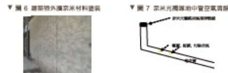
▼ 圖 6 建築外牆奈米材料塗裝 ▼ 圖 7 奈米光觸媒地中管空氣調節

主要在外牆採用奈米疏水油自潔塗料，以降低清潔維護成本，並應改建/增建/遷建需求，構件可重複拆除使用，達成再生循環永續發展的理念；並引進太陽能發電，利用通電、遮陽及隔熱玻璃降低室外溫度影響，透過浮力通風設計與地中管，引進地下較低溫度以維持室內恆溫，達成冬暖夏涼節省能源使用目的。