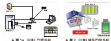
▲ 圖 1a RFID 門禁系統 ▲ 圖 2 RFID 資訊門牌系統

主要研發RFID門禁控管，有效控管人員進出，並結合空調溫濕自動監控調節系統減低能源消耗，RFID資訊門牌提供辨識建物身份，以利建管及地政作業。